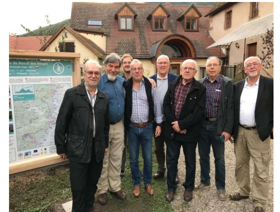
Dévoilement du panneau LQT-Rectangle Rouge à Châteauneuf avec la FERP, la FCV et les baliseurs et le président du CVS-HK

Pour finir, j'ai le plaisir de vous informer, que grâce à un don de l'Ambassadeur de Suède à Paris, le HK dispose désormais d'une toute nouvelle table de pique-nique qui vient d'être installée dans la carrière, devant l'Oedenbourg. Il faudra en profiter dès les premiers beaux jours du prochain printemps.