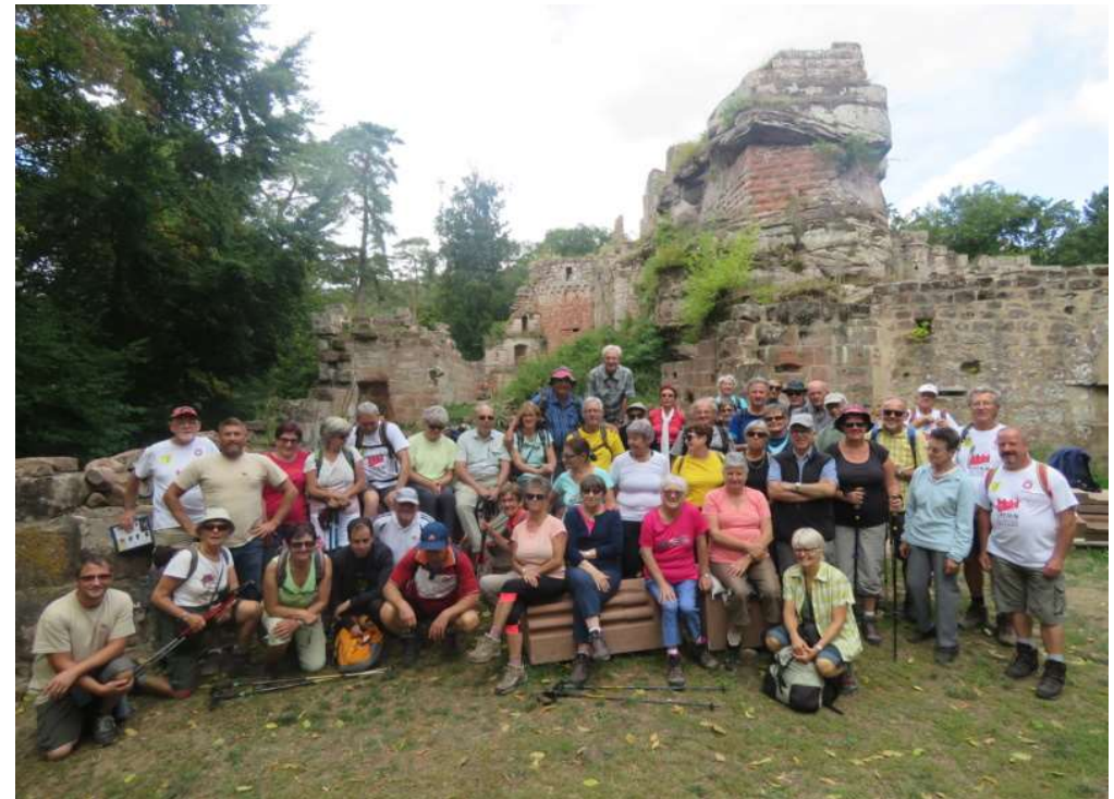
(Photo de groupe devant le château du Schoeneck lors de la sortie bus du 1 er septembre 2019)

Rédaction: Le Président en accord avec le Comité Directeur