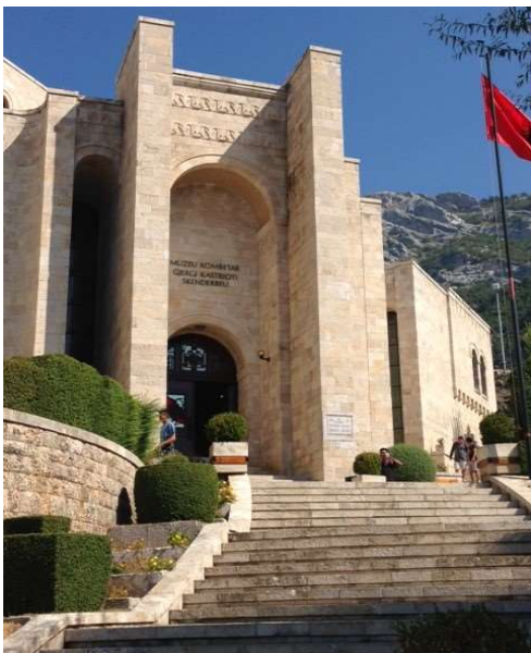
Le mausolée de Scanderbeg à Krujë