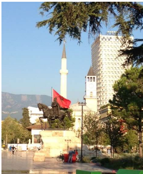
La place Scanderbeg à Tirana

Et puis, quelques jours à peine après le retour de ce beau voyage, ce fut la liasse à Orschwiller, le samedi 21 septembre, pour l'inauguration de la fontaine restaurée au centre du village et le dévoilement de 2 statues commémoratives.